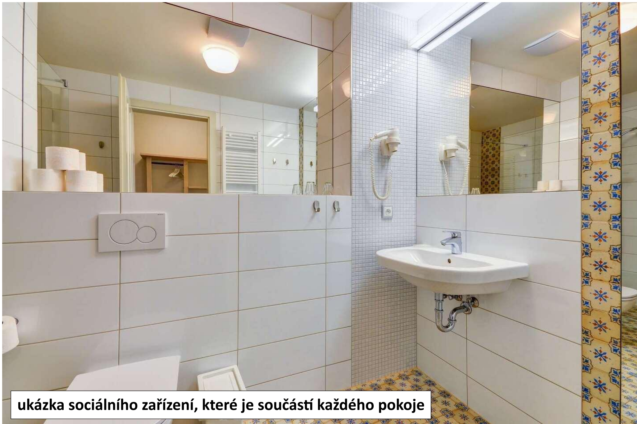
ukázka sociálního zařízení, které je součástí každého pokoje