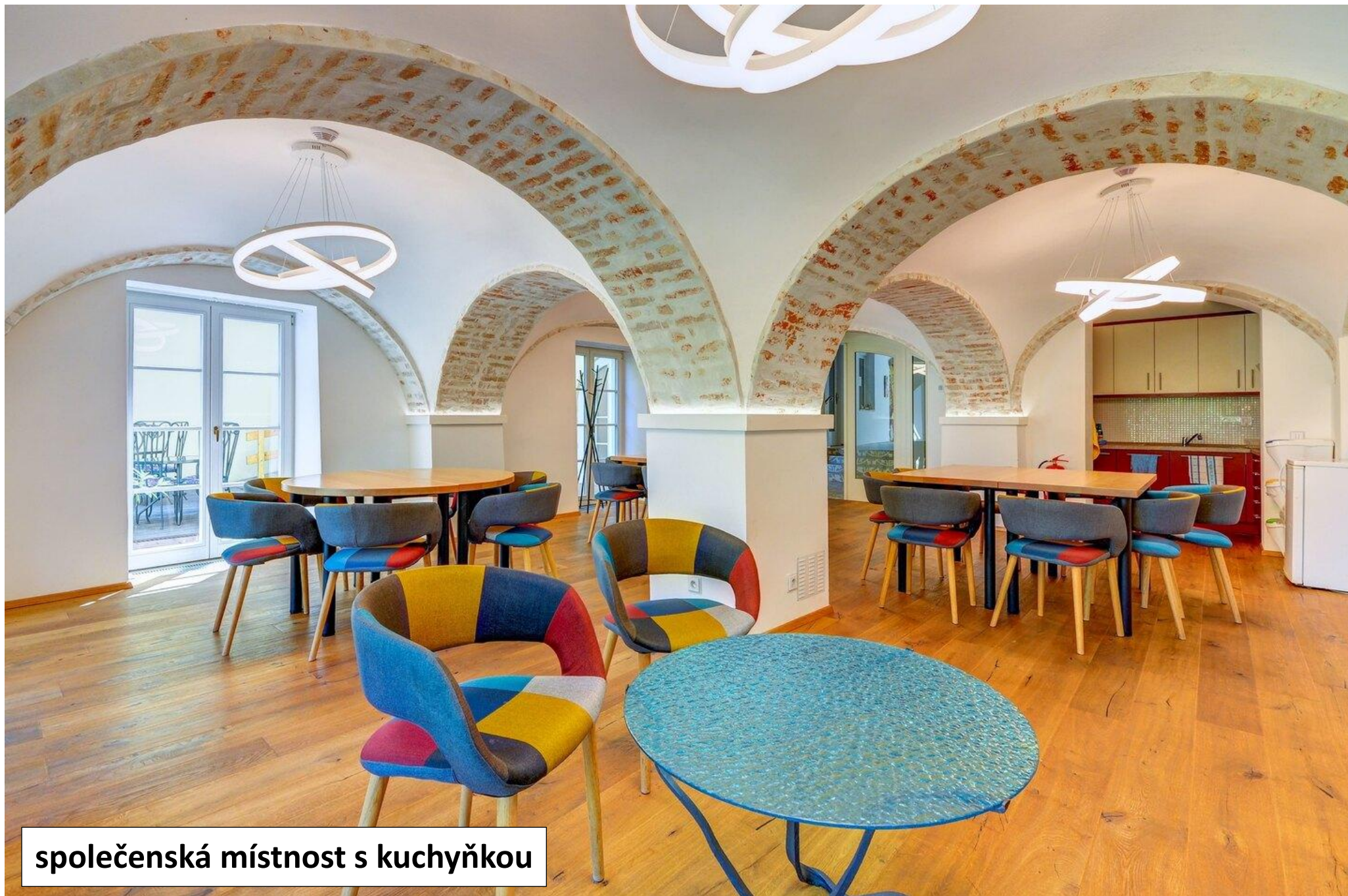
společenská místnost s kuchyňkou