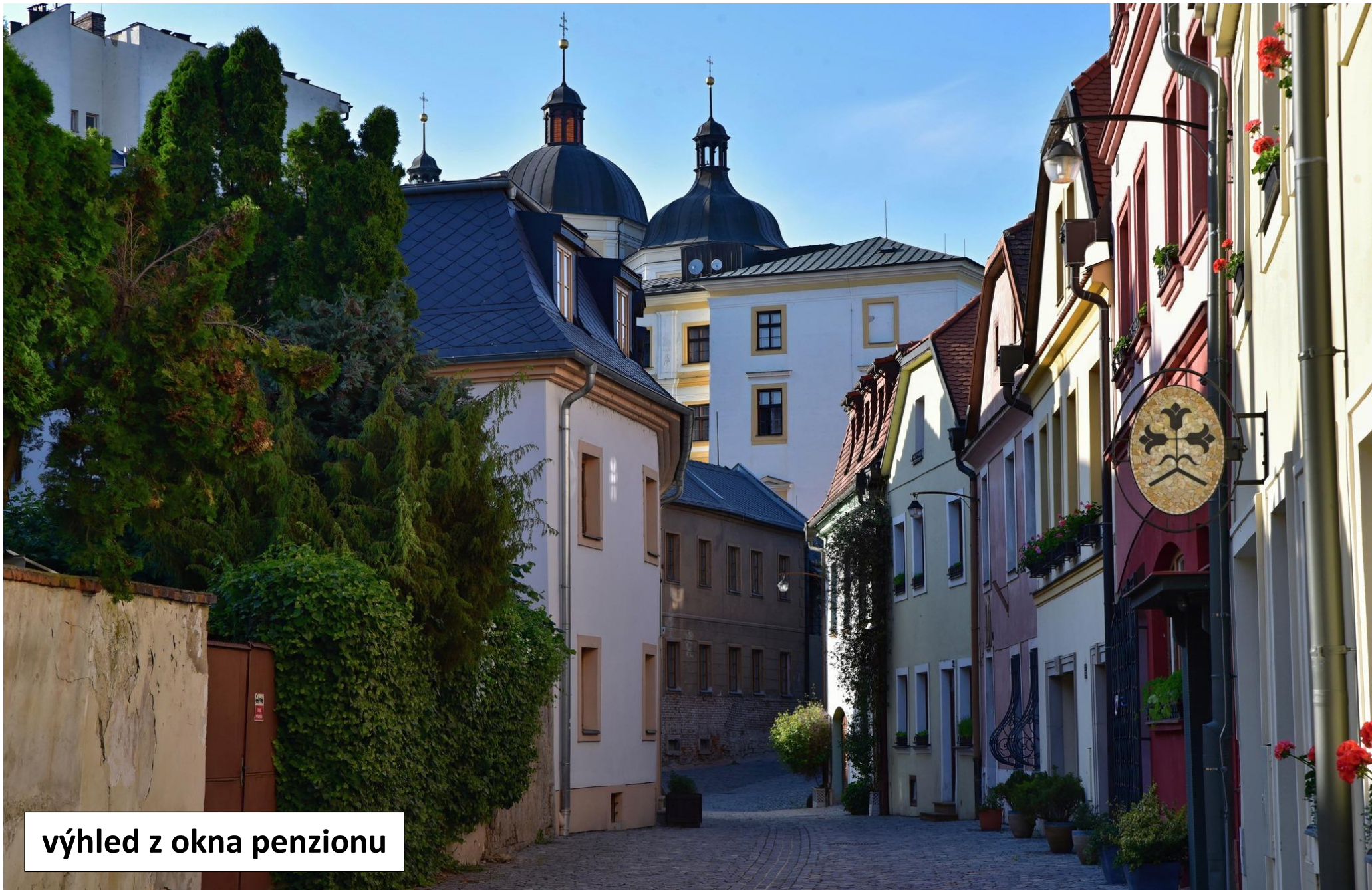
výhled z okna penzionu