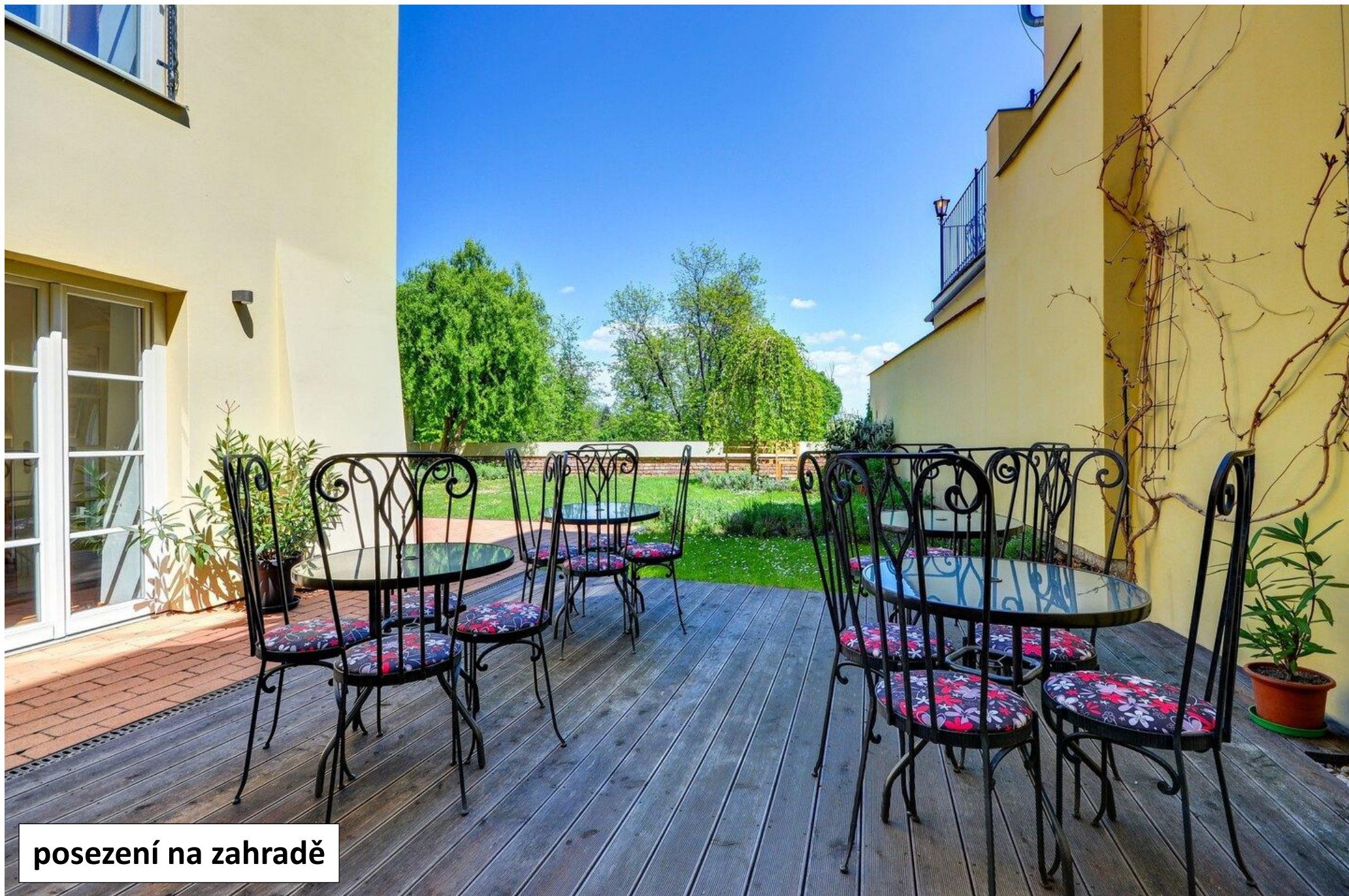
posezení na zahradě