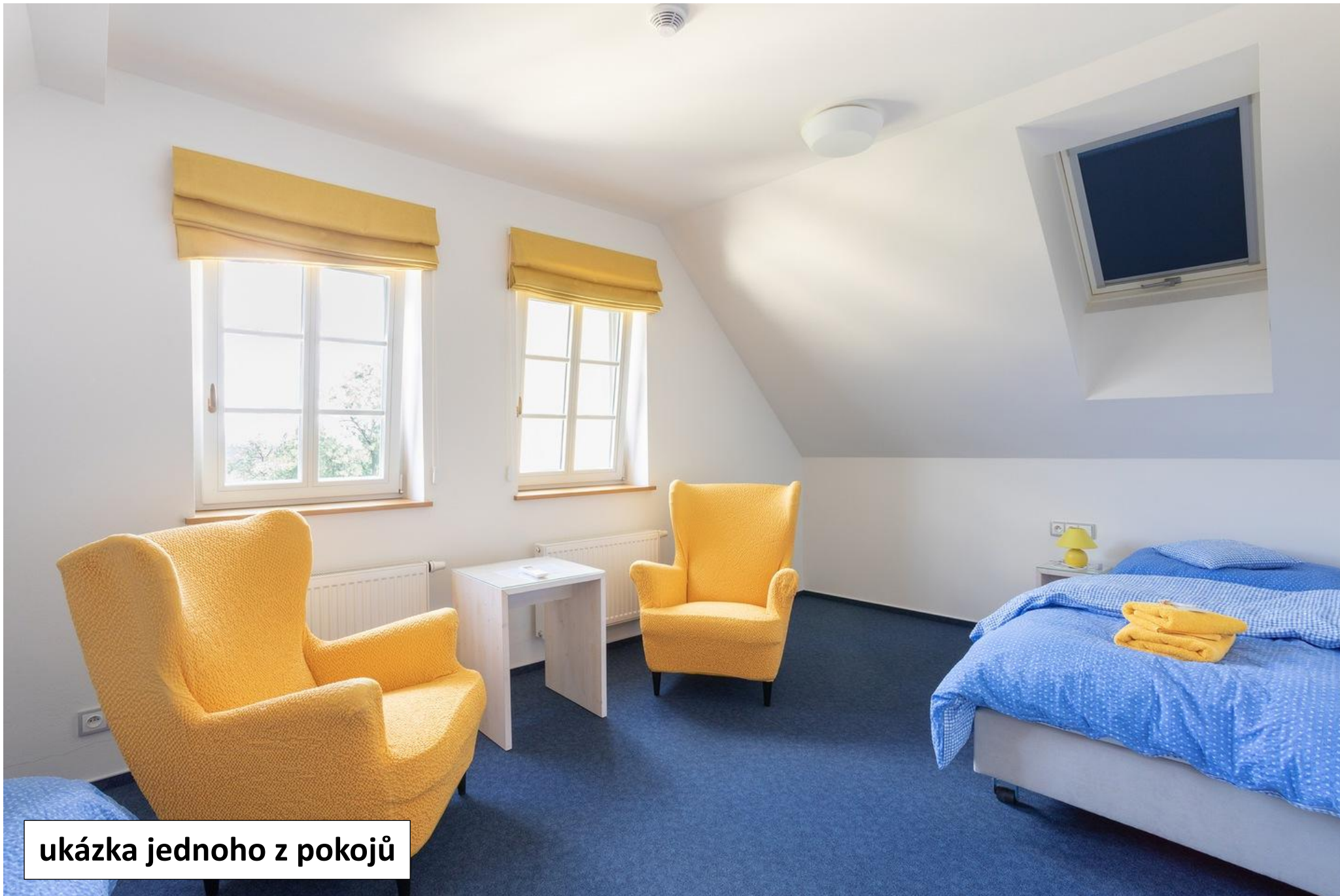
ukázka jednoho z pokojů